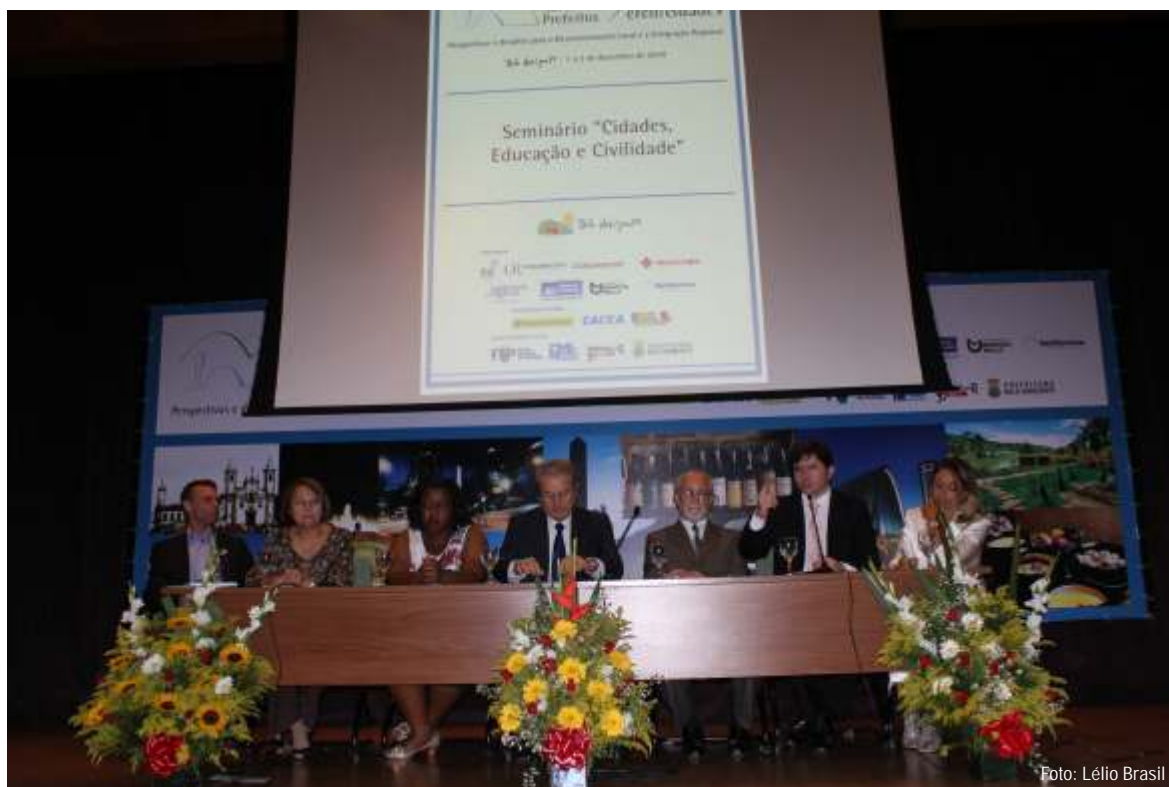
Mesa de abertura do Seminário "Cidades, Educação e Cívildade", com a presença do prefeito de Belo Horizonte, Marcio Lacerda.